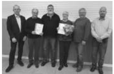
Jubilare mit Vorstand

Unter dem Tagesordnungspunkt „Verschiedenes“ wurden Vorschläge für den Vereinsausflug am 26. August gesammelt. Die Versammlung entschied sich für eine Schifffahrt mit Kaffeetrinken auf dem Harkortsee und einen Ausklang im Vereinsheim mit Reibekuchen. Mit einem gemeinsamen Gebet endete die Versammlung.