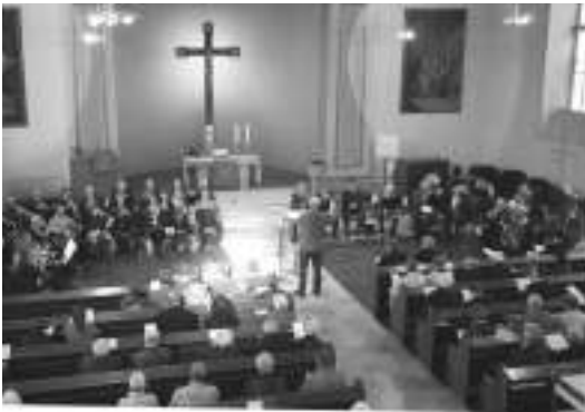
Bläsergottesdienst zum 125-Jährigen

Anfang des 19. Jahrhunderts, dem Beginn der Industriellen Revolution, starteten im Lande Lehrlinge und Gesellen ihre kleinen, überschaubaren, christlich geprägten regelmäßigen Zusammenkünfte. Das ist die Geburtsstunde erster „Jünglingsvereine“. Im Fokus standen junge Männer. Es ging bei dieser „Erweckungsbewegung“ um die „Vereinigung aller Kräfte und Mittel zur Ausbreitung des Reiches Gottes